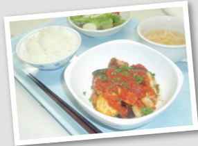
食事例/ラタトゥウ (野菜のトマト煮込み)

〈朝食〉 朝食は1日のスタート。食べやすく、バランスの取れた献立を考えて毎朝提供しています。