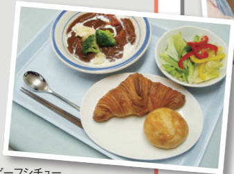
食事例/ビーフステーキ

〈夕食〉 「受験生の基本体力は夕食から」と考えて、カロリーと栄養のバランスを考えて提供しています。